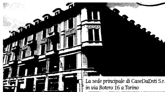
La sede principale di CaseDaEnti S.r.l., in via Botero 16 a Torino