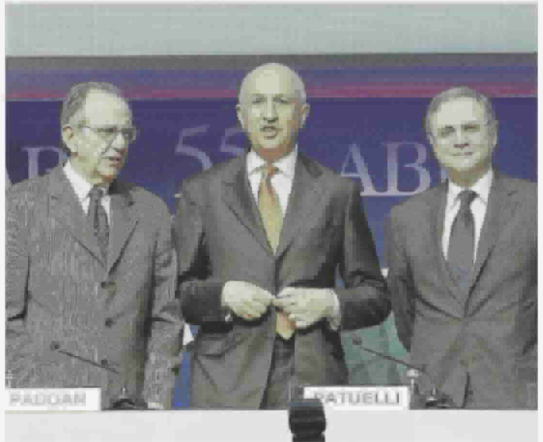
I magnifici 3 Il ministro Pier Carlo Padoan, Ignazio Visco (Bancaitalia) e Antonio Patuelli (Abi)