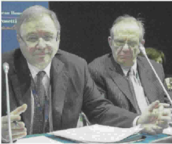
Il duo Il governatore Visco e il ministro Pier Carlo Padoan